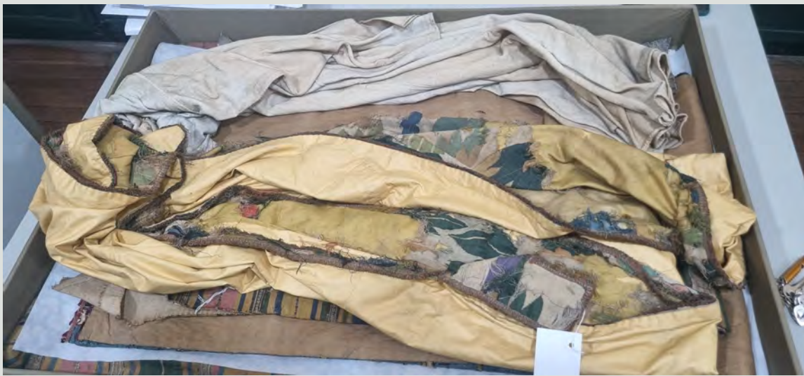
Estado actual de los textiles históricos (imagen 1). La conservación es deficiente, evidenciando el deterioro acumulado de piezas clave como la casulla de la primera misa en Santa Fe de Bogotá.

Necesidad de Visibilización: Es urgente desarrollar iniciativas que rescaten estos objetos, destacando su relevancia y conectándolos con la identidad cultural de Bogotá.