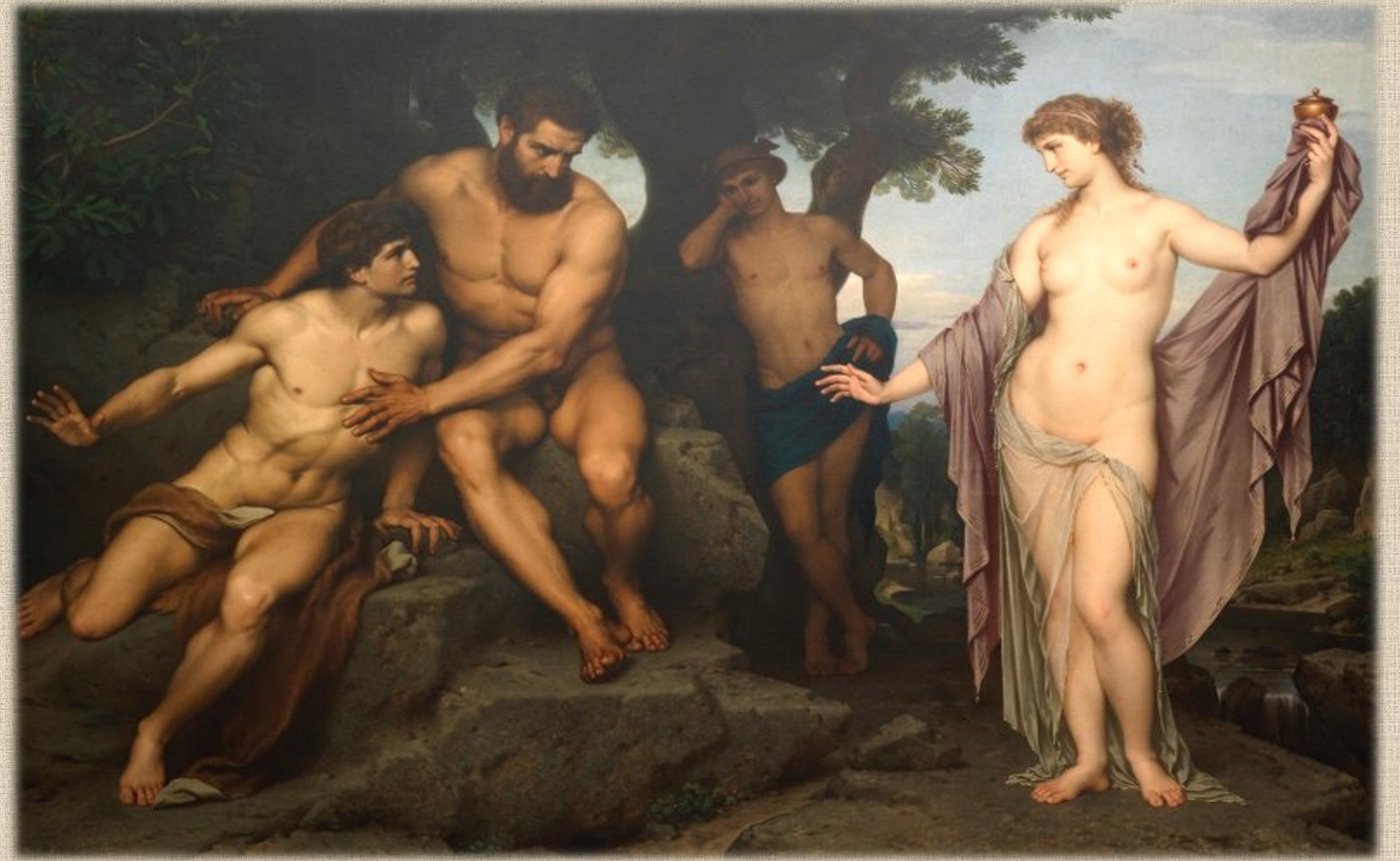
Prometeo y Epimeteo ante Pandora. Pintura de Hermann Julius Schlösser (1878)

El objetivo del presente ensayo es plantear la posibilidad de una teoría positiva del pensamiento reaccionario a partir de su comprensión de la historia, su devenir y la tradición. Dicha teoría, trata de explicar el pensamiento reaccionario como un conjunto de percepciones distintas, sosteniendo que aun cuando puedan ofrecerse temas comunes y sentencias similares, dicho pensamiento no es ni puede constituirse en un corpus único, ni mucho menos traducirse en un programa político concreto. Teniendo esto presente, se sostiene la viabilidad de clasificar varias de las posturas reaccionarias según su relación y comprensión de la historia, su devenir y la tradición que se exalta o se destaca en relación con su crítica de la contemporaneidad.