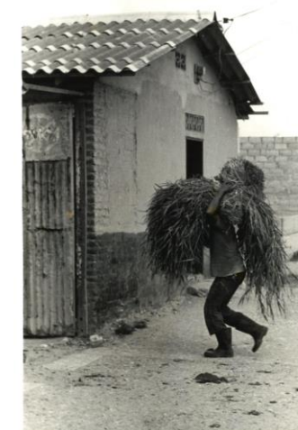
Serie Huellas . (1976). Esbra. Fot.